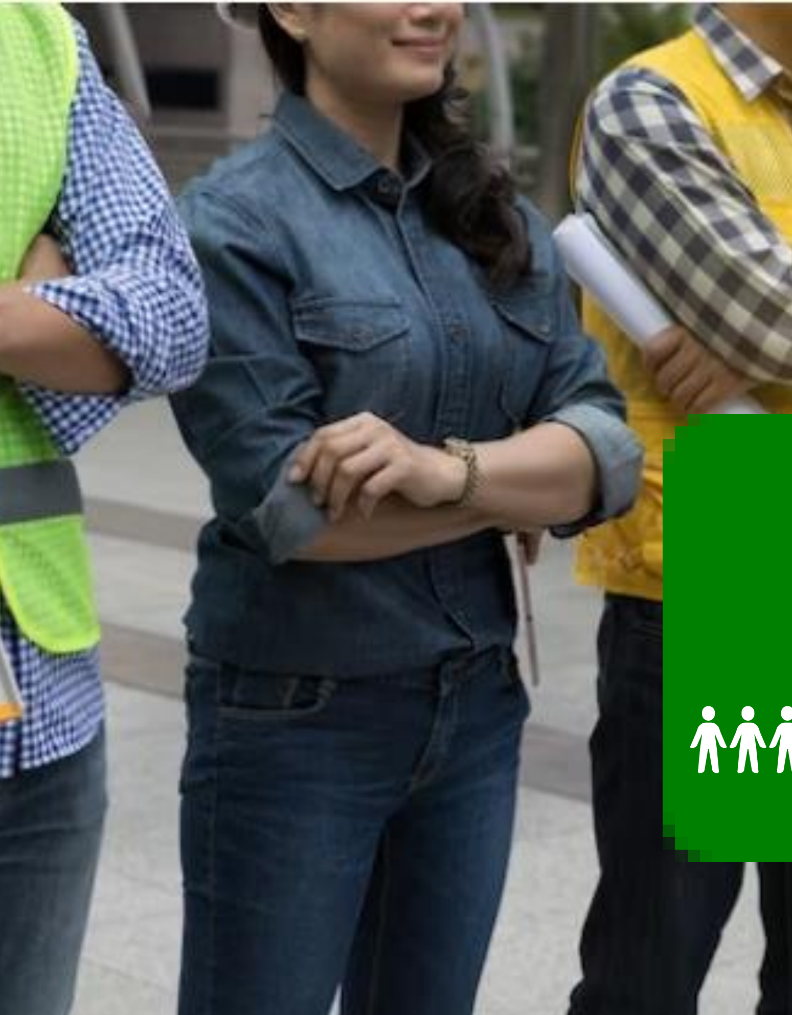
Figura de Propuestas no solicitadas

Para efectos de promover, fomentar la participación ciudadana y la atracción de inversiones en materia de infraestructura.