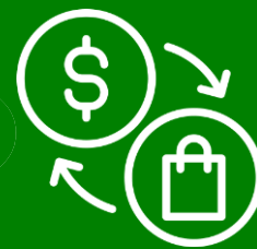
Figura de las propuestas no solicitadas