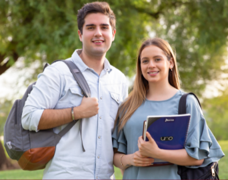
VOZ DE LA EDUCACIÓN