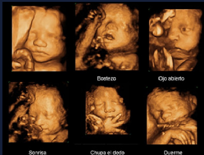
Ultrasonido de un bebé en el seno materno

El pueblo y legisladores responsables han venido rechazado estos intentos desde hace años. Pero esta nueva embestida es la mayor que se ha dado hasta ahora, con el apoyo de tanto dinero que podría alcanzar para –digo yo- ofrecer jugosas "mordidas". Desgraciadamente, el proyecto de dictamen pasó por 19 votos a favor, 4 en contra y 4 abstenciones. Y de pilón, también se liberalizó más el consumo de marihuana para "uso lúdico".