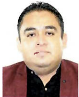
DIP. FRANCISCO JAVIER RAMÍREZ NAVARRETE