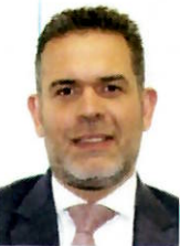
DIP. JORGE ARTURO ARGÜELLES VICTORERO