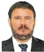
DIP. JUAN ENRIQUE FARRERA ESPONDA