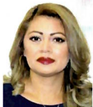
DIP. ANA KARINA ROJO PIMENTEL