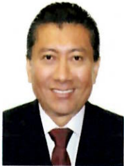
POOL MOO JESÚS DE LOS ÁNGELES